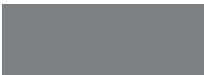
Staubgrau RAL 7037