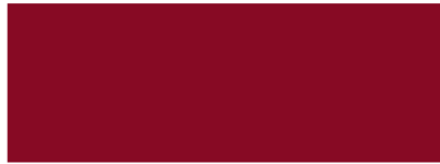
Rubinrot RAL 3003