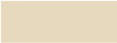
Hellelfenbein RAL 1015