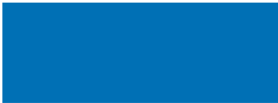
Himmelblau RAL 5015