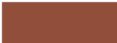
Kupferbraun RAL 8004