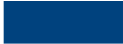
Enzianblau RAL 5010